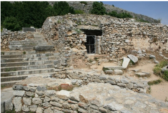
Pál apostol börtöne.

antiszemitizmus jól működött azokban az időkben is, úgy tűnik... A város tisztviselői hagyták magukat rábeszélteni, hogy a római törvényekre és szokásokra hivatkozva megkorbácsolják Pált és Silást, és börtönbe vessék őket. Másnap azonban, amikor azt javasolták Pálnak, hogy a hátsó ajtón keresztül távozzon, kiderült, hogy Pál római állampolgár. 17 Csak ekkor kezdtek el félni a város vezetői, mert kiderült, hogy egyáltalán nem tartották be a római törvényeket. Cicero híres peréből, amelyet Gaius Verres, Szicília római helytartója ellen folytatott, aki megkorbácsoltatott, sőt keresztre feszítettetett egy római polgárt, tudhatták, milyen súlyos következményei lehettek volna mulasztásuknak. 18 Nem csoda, hogy kénytelenek voltak bocsánatot kérni Páltól, és hivatalosan kivezették a börtönből. Míg a város legmagasabb politikai szintjei nyilvánvalóan csak szavakban tartották be a római törvényeket (egy római polgárt formális eljárás nélkül ítélték el), addig a börtönőr, aki alacsonyabb rangú tisztviselő volt, olyan komolyan vette a feladatát, hogy akár az öngyilkosságra is hajlandó volt, ha úgy gondolta, hogy a foglyai megszöknek. 19 A hely, ahol Pál börtöne lehetett, ma is látható a turistáknak az ókori Filippi városának maradványaiban.